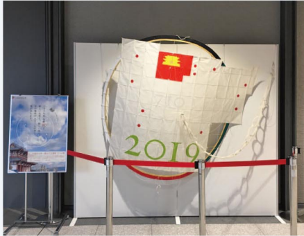
平城京大風1/3モデルの試作品 平城宮いぎない館にて展示中

遷都とは都を遷すこと。ただ、建物や政治機能を遷すだけではなく、当時そこに住む、人の営みや夢も遷っていきました。夢の大空遷都2019とは、平城京を大空に遷都するというテーマの元、平城京(外京を含む)の形をした大風と、ワークショップで制作された鳳尾をみんなで大空へ揚げる、現代と1309年前の時空が融合する「夢」の遷都大風祭りです。又、大風は史的な資料を参考に平城京の街路(碁盤の目)を骨組みにし、主要な寺社などの位置取りなどを忠実に再現。又奈良県産吉野和紙を使用し作り出す5.2m×6mの歴史大風です。そして、2019年は新しい年号で新しい時代が始まる年。そのお祝いとして、古都祝ぐとして、様々な人達の力により古(いにしえ)の“都”が空高く飛び立つ現代の祝祭の風景を、参加者と共に創り出していきます。イベント終了時にはいぎない館にて常時展示され、見る形ではない、遊べる、空に見上げる教本として、日本のふるさとと地からみなさんの夢と共に大空に舞い上がります。