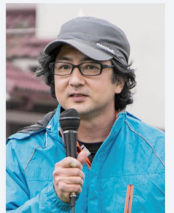
※気流部とは、森野晋次(現代美術作家)を代表とする、現代アートプロジェクトグループ。国際芸術祭や展覧会など、参加多数。 WEB http://kiryu-bu.com

kiryu-bu site-specific art project in NARA palace-site