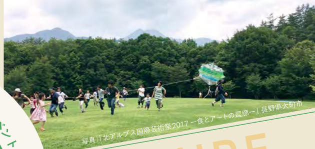
写真「北アルプス国際芸術祭2017 一食とアートの廻廊」長野県大町市